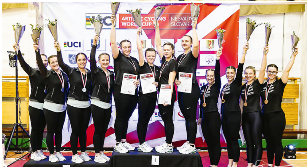
Oben: Aufstellung des Teams.