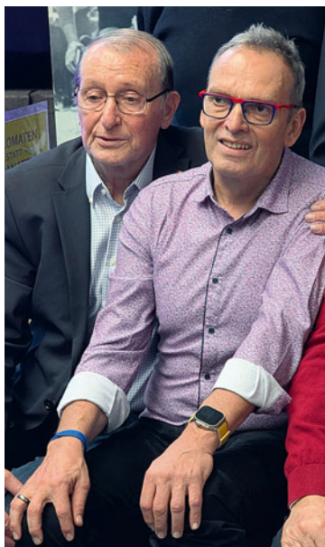
Auch Olympiasieger Olaf Ludwig ließ es sich nicht nehmen, bei den Feierlichkeiten vor Ort zu sein.