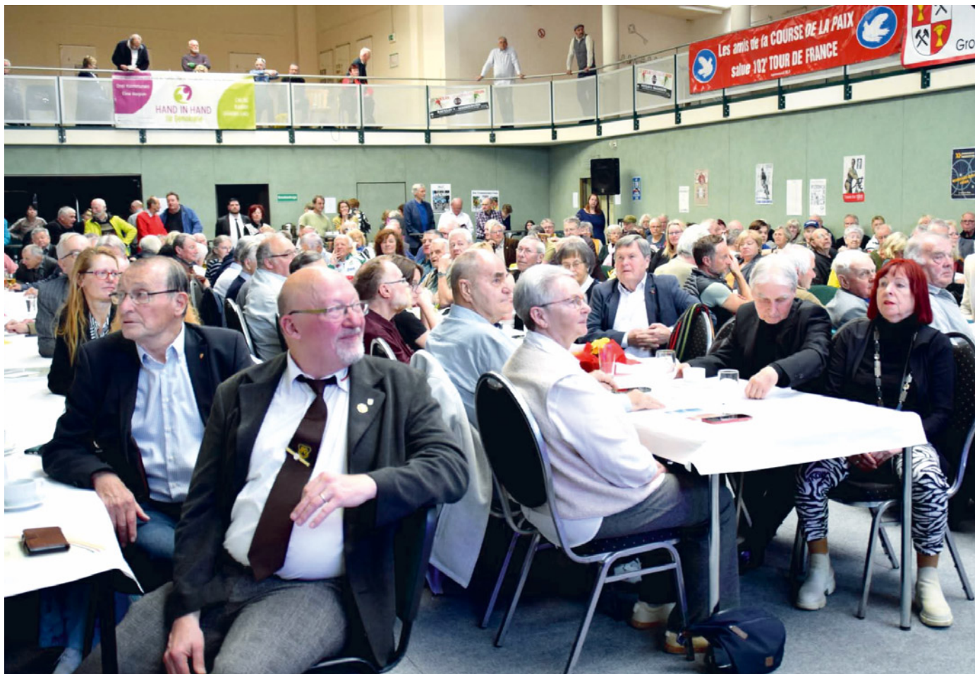
Blick in das gut gefüllte Sportzentrum.

Es war eine großartige Veranstaltung, die allerdings einen Misston hatte, der ständig zur Sprache kam: