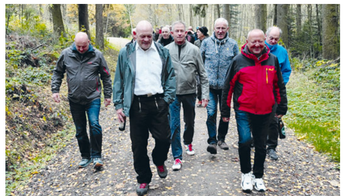
Die Teilnehmer gedachten den verstorbenen Weggefährten, bevor sie zur obligatorischen Wanderung aufbrachen.