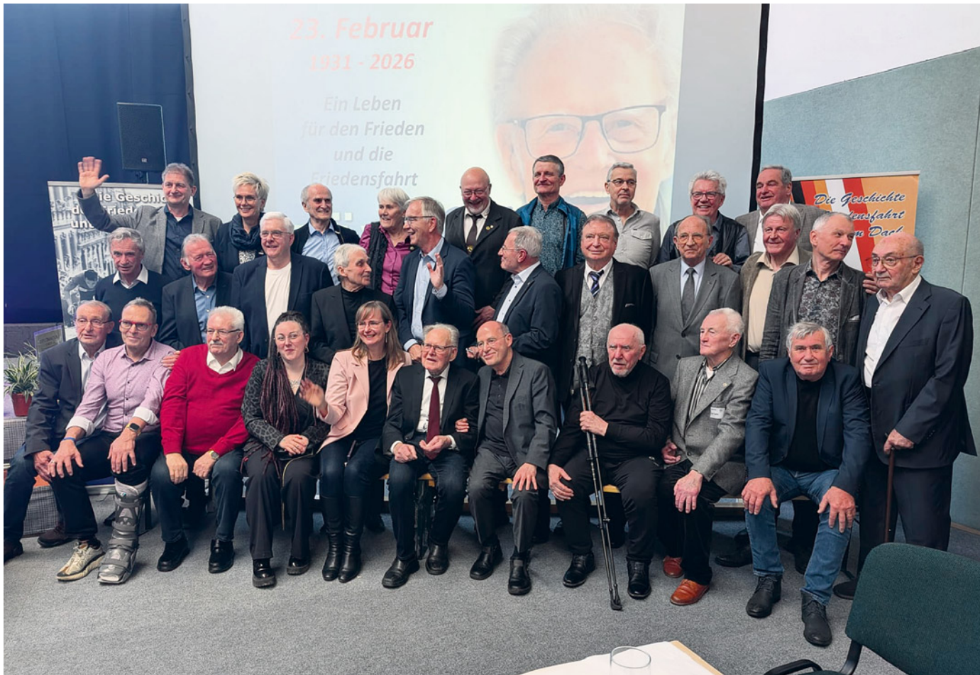
Jede Menge Prominenz war nach Kleinmühlingen gekommen.