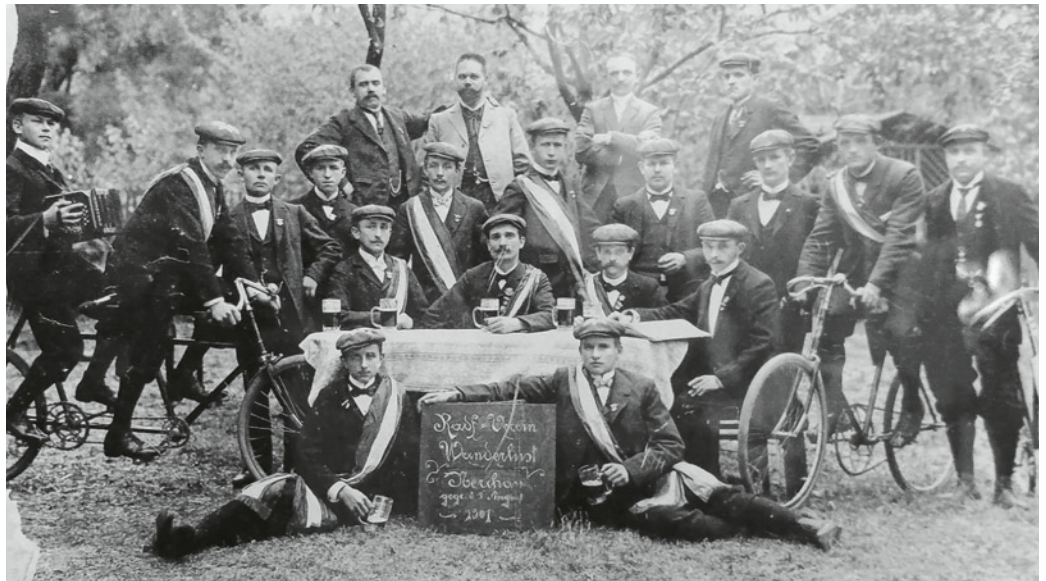
Gründungsfoto des Rad-Vereins Wanderlust Nerchau aus dem Jahr 1901.